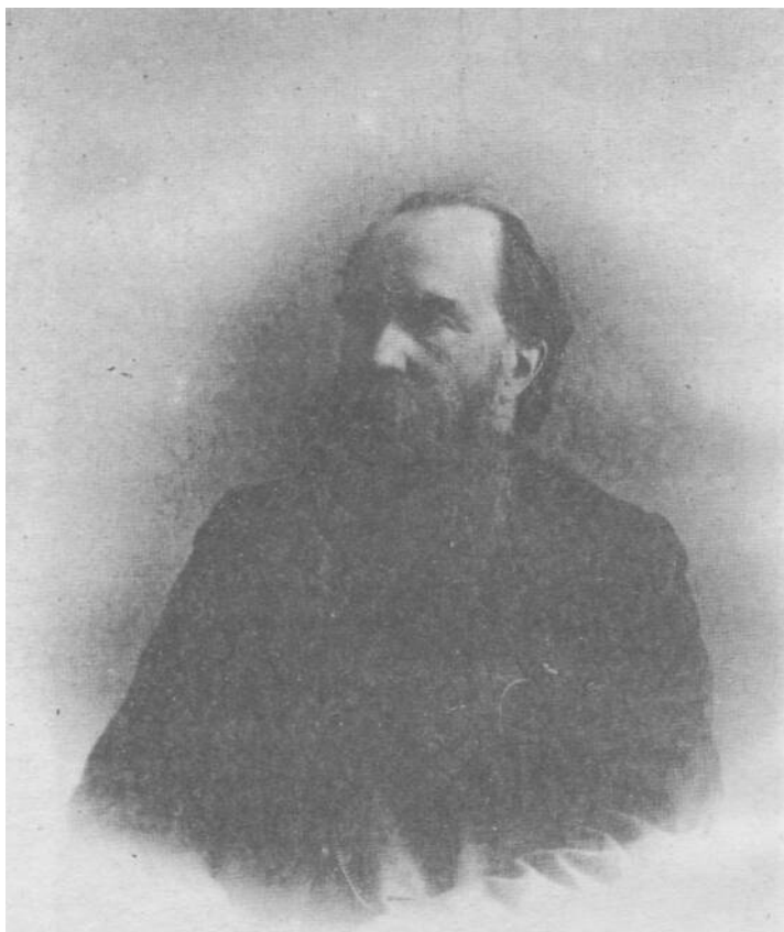
Русский ученый А.О. Ковалевский

Бок о бок с Ковалевским работал Мечников, проводивший успешные исследования на иглокожих, губках, кишечнополостных.