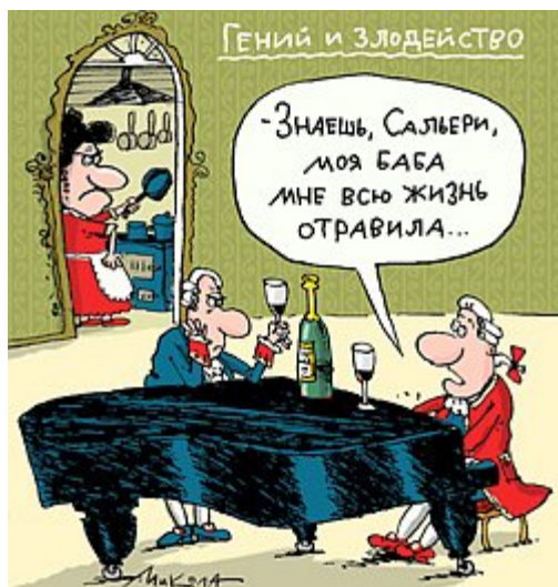
Рис. Николая ВОРОНЦОВА.