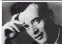
Ученый раб, свободный духом