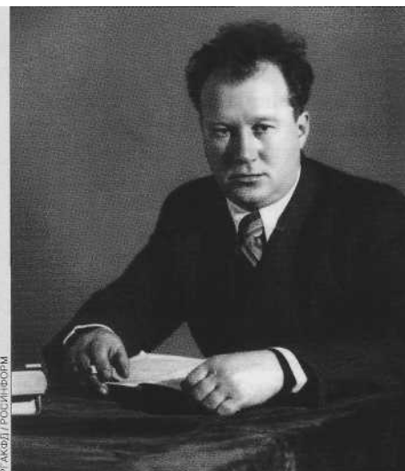
Павел Юдин, Марк Митин и Бернард Быховский не разглядели в классиках немецкой философии могильщиков своей карьеры

лавил журнал «Под знаменем марксизма», а в 1939 году был введен в ЦК партии и встал во главе Института Маркса—Энгельса—Ленина. Юдин же в 1932 году возглавил Институт красной профессуры, в 1937 году — Объединение государственных книжно-журнальных издательств (ОГИЗ), а в 1938 году одновременно стал руководить Институтом философии АН СССР. Митин и Юдин неустанно громили «врагов» в своих статьях, но крупных философских трудов из-под их пера не выходило. Другим философам тоже не давали развернуться, дабы никто не смел затмевать достижения высокого начальства. Самым масштабным проектом той поры была многотомная «История философии», которая должна была дать новый, марксистский взгляд на развитие человеческой мысли. За эту грандиозную задачу взялся юдинский Институт философии, и в 1940 и 1941 годах вышли первые два тома. Однако с третьим томом вышла осечка, которая повлекла за собой самую крупную философскую дискуссию сталинской эпохи, причем философы, как всегда, боролись не столько за научную истину, сколько за теплые места.