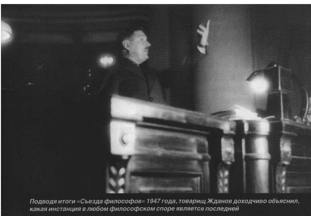
Подводя итоги «Съезда философов» 1947 года, товарищ Жданов доходчиво объяснил, какая инстанция в любом философском споре является последней

образом переработать». Выводы по общему положению дел в философии были сложные: «То обстоятельство, что книга не вызвала сколько-нибудь значительных протестов, что потребовалось вмешательство Центрального Комитета и лично товарища Сталина, чтобы вскрыть недостатки книги, означает, что на философском фронте отсутствует развернутая большевистская критика и самокритика... А разве наш философский фронт похож на настоящий фронт? Он скорее напоминает тихую заводь или бивуак где-то далеко от поля сражения. Поле боя еще не захвачено, соприкосновения с противником большей частью нет, разведка не ведется, оружие ржавеет, бойцы воюют на свой страх и риск, а командиры или упиваются прошлыми победами, или спорят, хва-