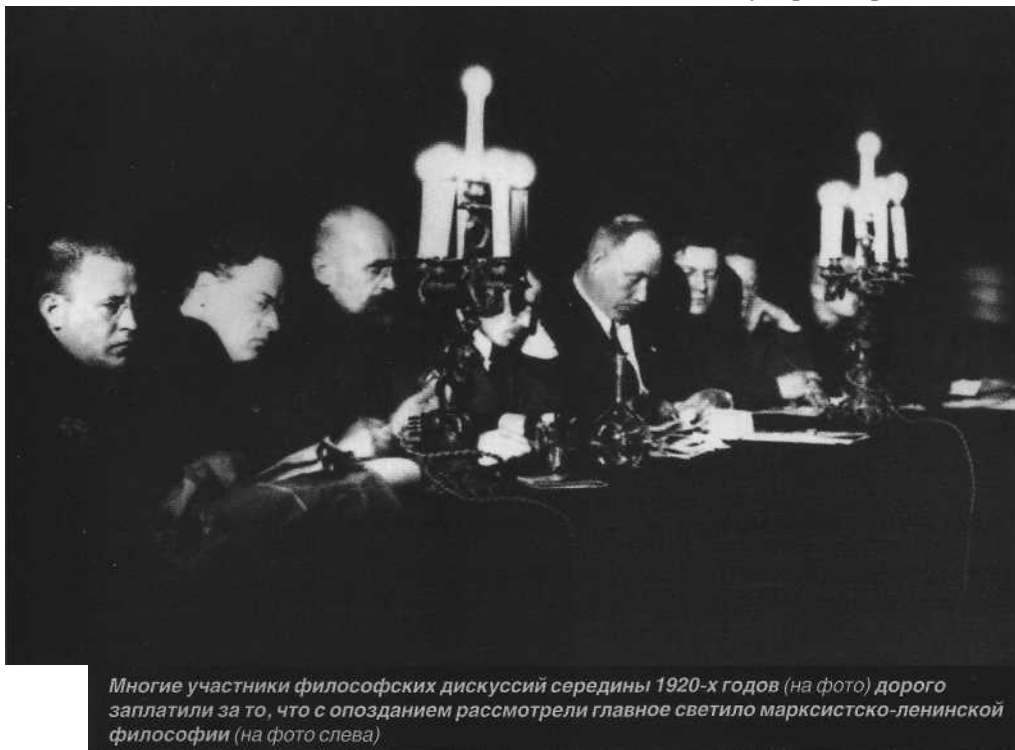
Многие участники философских дискуссий середины 1920-х годов (на фото) дорого заплатили за то, что с опозданием рассмотрели главное светило марксистско-ленинской философии (на фото слева)

Повод к новой дискуссии подал лично Сталин, когда 27 декабря 1929 года на конференции аграрников-марксистов заявил: «Надо признать, что за нашими практическими успехами не поспевают теоретическая мысль, что мы имеем некоторый разрыв между практическими успеха-