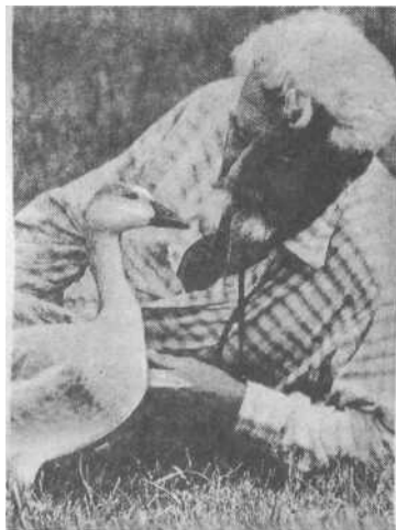
С одним из своих друзей. 60-е годы.

В лагерных отчетах подробно анализируются причины потери пленными трудоспособности. На первом плане — скудное питание, в худшие времена всего 2105 ккал на человека