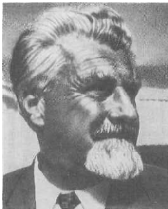
Конрад Лоренц (1903—1989).

Не новость, что Лоренц воевал в немецкой армии на территории СССР и был в плену.