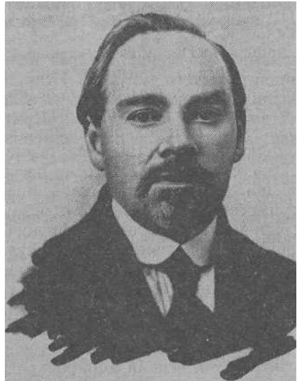
Александр Александрович Богданов (Малиновский) (1873—1928)

Это заметным образом проявилось в сборнике «Очерки реалистического мировоззрения», который подготовила к изданию группа марксистов, сплотившихся вокруг А. А. Богданова и А. В. Луначарского в Вологодской ссылке 69 . Эта работа должна была служить ответом на издание сборника «Проблемы идеализма». Во введении к «Очеркам...» идеализм несколько парадоксально отвергался как пагубное последствие эпохи идейной слабости и морального разложения, как проявление недоверия к человеческим возможностям и попытка найти убежище в мнимых метафизических твердынях. В противовес тому реалистическое мировоззрение, исповедуемое авторами сборника, находит опору в самой действительности, решительно отвергает всякий абсолют и ни в коей мере не претендует на окончательную истину 70 . Авторы сборника («реалисты») критикова-