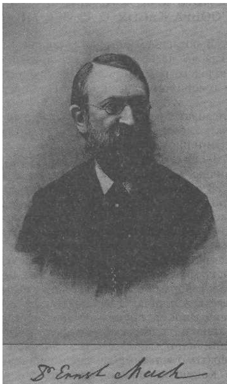
Эрнст Мах (1838—1916)

Мах же, напротив, приобретал все большую известность. Современная физика высоко оценила его научные труды, а благодарность Эйнштейна (хотя сам Мах ее и не принял) способствовала тому, что к нему обращались как к пророку новейшего естествознания 8 . На эпистемологию Маха ссылались неопозитивисты Венского кружка, черпая в ней свое вдохновение и рассматривая ее как основу дальнейших поисков 9 . Но влияние воззрений Маха, особенно в Центральной Европе, не ограничивалось только профессиональными — научными и философскими — кругами: его система взглядов оказала воздействие на таких писателей, как Шнитцлер (Schnitzler), Бар (Bahg), Г Hofmannsthal) и особенно Музиль (Musil), который посвятил Маху свою философскую диссертацию. Тогда же австрийский марк-