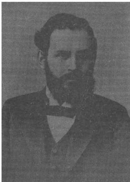
Владимир Александрович Базаров (Руднев) (1874—1939)

объективной науки об обществе, уверенно объясняющей социальную реальность и ее развитие. Для них впавший в «грех махизма» марксизм оказывается в болоте того самого релятивизма народников, ранее подвергнутого Плехановым столь резкой критике. Слова, с которыми в конце XIX в. Плеханов обращался к «субъективным социологам», казались теперь вполне применимыми к махистам: «...взгляды людей всегда "субъективны", так как те или другие взгляды составляют одно из свойств субъекта . Объективны не взгляды "толпы", объективны те отношения в природе или обществе, которые выражаются в этих взглядах . Критерий истины лежит не во мне, а в отношениях, существующих вне меня. Истинны взгляды, правильно представляющие эти отношения; ошибочны взгляды, искажающие их. Истинна та естественнонаучная теория, которая верно схватывает взаимные отношения явлений природы; истинно то историческое описание, которое верно изображает общественные отношения, существовавшие в описываемую им эпоху» 77 .