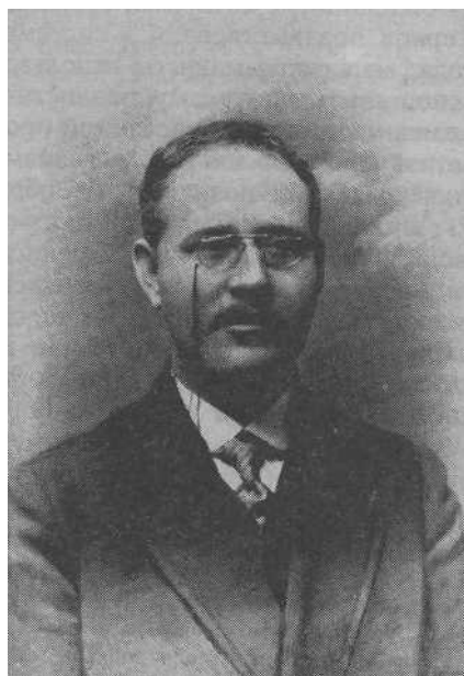
Павел Соломонович Юшкевич (1873—1945). Фотография 1900—1901 гг.