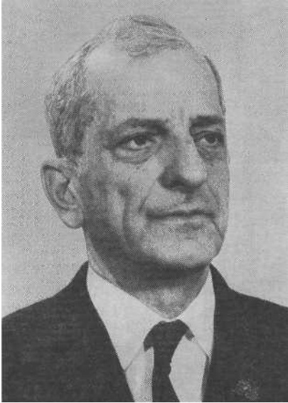
Грант Константинович Цвєрава (1911—1994). Фото 1973 г.

ли, подготовленная Л. Г. Лейбсоном [23]. В 1990 г. автор (еще до официальной отмены цензуры) издал книгу, в которую включил все изъятое в процессе издания материалы, и назвал ее «Академик Л. А. Орбели: Неопубликованные главы биографии» [24].