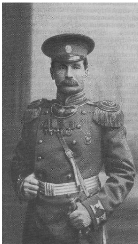
Полковник Генерального штаба П. К. Козлов. 1912 г.

О том, как воспринял Козлов бурные события 17-го, особенно октябрьский переворот, мы не знаем. В обширном личном архиве путешественника в РГО и в музее-квартире в Санкт-Петербурге отсутствуют какие-либо документальные свидетельства этого периода, позволяющие судить о его политических пристрастиях.