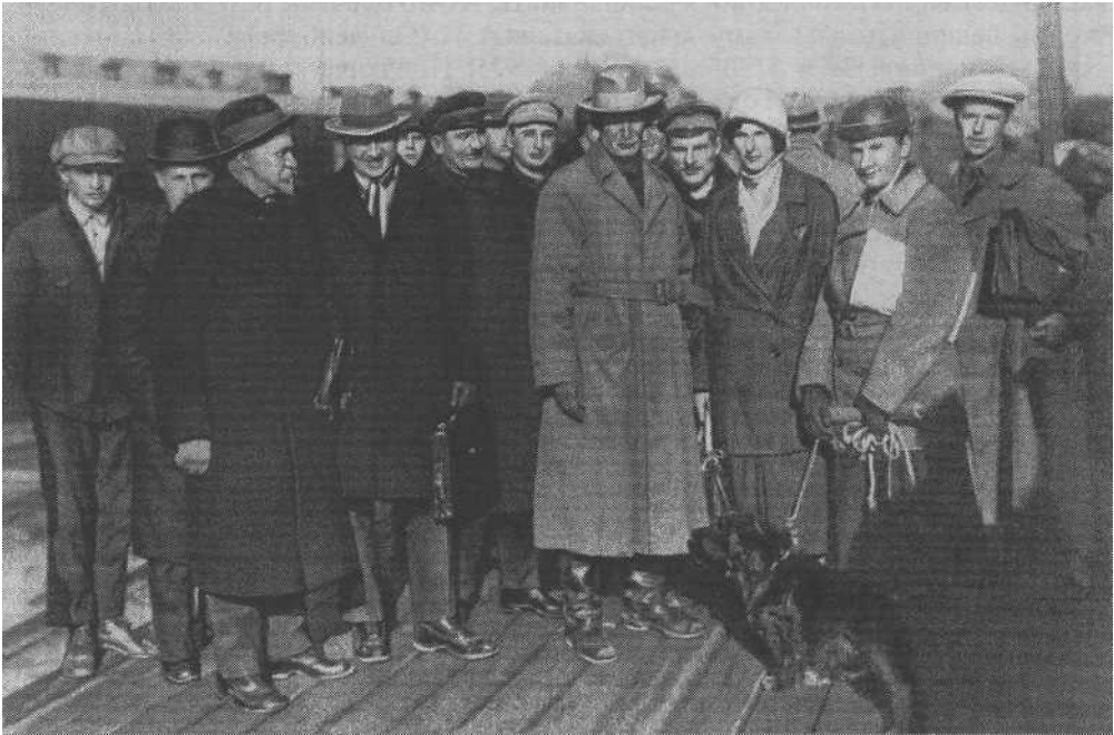
Возвращение экспедиции в Ленинград. Октябрь 1926 г.

В целом путешествие по Южной Монголии принесло немало ценных находок, однако повторить ноин-ульский успех Козлову, увы, было не суждено.