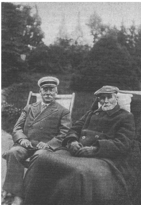
Ю. М. Шокальский и П. К. Козлов. Дом отдыха в Старом Петергофе, 1935 г.

В своих дневниках Козлов подчеркивает, что наука и политика — «две вещи разные», особенно для него, «искренне-го любителя первой и совершенно не любящего вторую» [35, л. 405, 4 ноября 1924]. Но жизнь не позволяет ему сделать выбор по душе, потому что наука в той или иной степени всегда связана с политикой, тем более в Советской России. И тем более, когда речь идет о научной экспедиции в столь важный в стратегическом отношении регион, как Центральная Азия. И все-таки высокие моральные качества, мужество и преданность Козлова идеалам своих великих предшественников оказались достаточно сильным противовесом давлению и интригам властей, и его «родное детище» — Монголо-Тибетская экспедиция — сумела оправдать возлагавшиеся на нее надежды и вписала еще одну славную страницу в летопись русской географической науки.