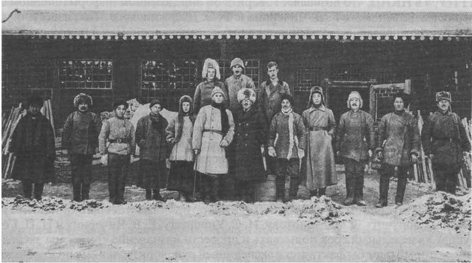
Шведский путешественник Свен Гедин (в центре) среди членов Монголо-Тибетской экспедиции. Урга, ноябрь 1923 г.