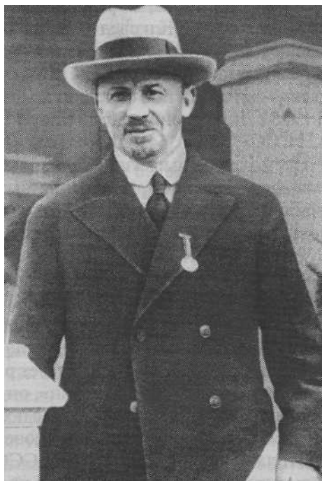
Н. И. Бухарин — глава советской делегации на Международном конгрессе по истории науки и техники. Лондон, июнь 1931 г.

* Запись беседы была сделана будущим академиком-философом М. Б. Митиным. Водном из фрагментов беседы содержится важное свидетельство Сталина, на наш взгляд, в какой-то мере помогающее понять природу его покровительства Ламарку: «Навопрос "Каковы наши теоретические задачи в области естествознания?" т. Сталин отвечает: "Я не естествовик. Правда, в молодости я много читал Ламарка, Вейсмана, увлекался неоламаркизмом. У Вейсмана очень много мистики, то, что у нас пишется по вопросам теоретического естествознания, имеет много виталистического. Материалы в "БСЭ" по этой линии — по меньшей мере сумбур"».