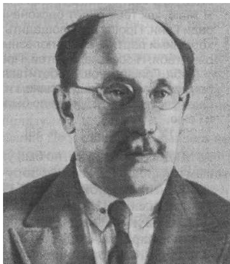
А. М. Деборин

Абрам Моисеевич Деборин (Иоффе), как и Н. И. Бухарин, входил в первую группу академиков-коммунистов, избранных в АН в 1929 г. Рабочий-металлист, он рано увлекся революционными идеями, с конца 1890-х гг. — член РСДРП. Сначала (1903 г.) примыкал к большевикам, в 1907-1917 гг. — меньшевик. В 1908 г. окончил философский факультет Бернского университета. С 1920 г. занимался научной и преподавательской деятельностью. Работал в Коммунистическом университете им. Я. М. Свердлова, Институте Маркса-Энгельса, Институте красной профессуры философии, его директор в 1924-1931 гг. Один из видных философских авторитетов 20-х гг.*. А. М. Деборин был членом редколлегии, а с 1926 г. ответственным редактором главного философского журнала того периода — «Под знаменем марксизма». В 1930 г. был обвинен в «меньшевистствующем идеализме», снят с поста редактора журнала и директора ИКП философии [14].