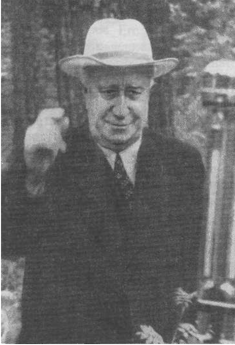
В. Н. Сукачев, 1957 г.